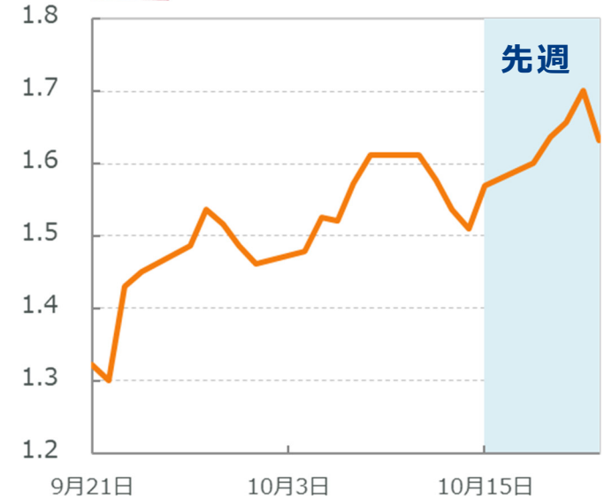
🇺🇸 米国10年国債利回り