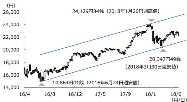
【図表2：日経平均株価のトレンドチャネル】

(注) データは2016年4月1日から2018年6月22日。週次ベース。