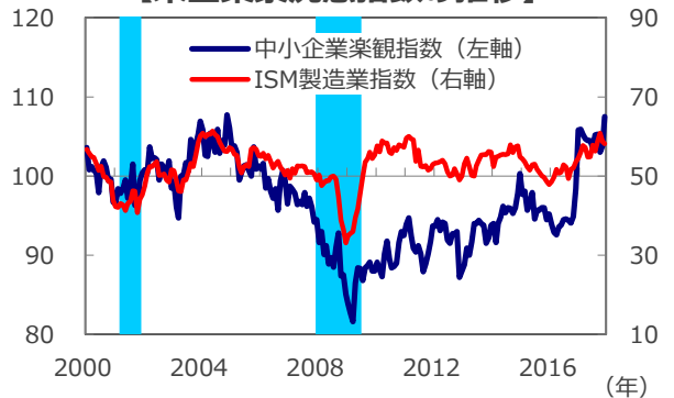
【米企業景況感指数の推移】