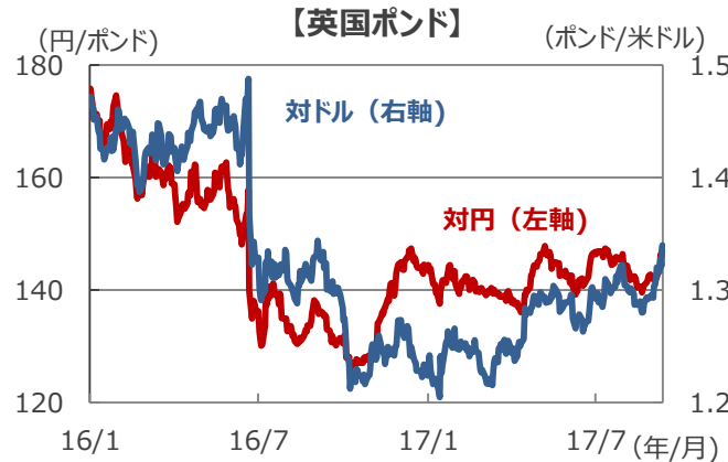
(注) データは、2016年1月4日～2017年9月14日。