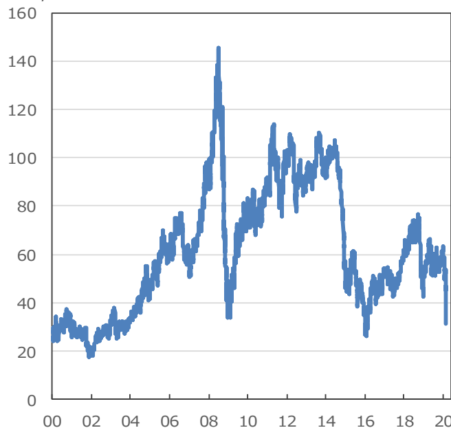
(米ドル/バレル) 【WTI先物価格の推移】