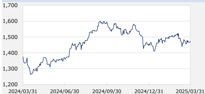
S&P先進国REIT指数（除く日本、配当込み）