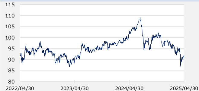
円/オーストラリアドル（円）