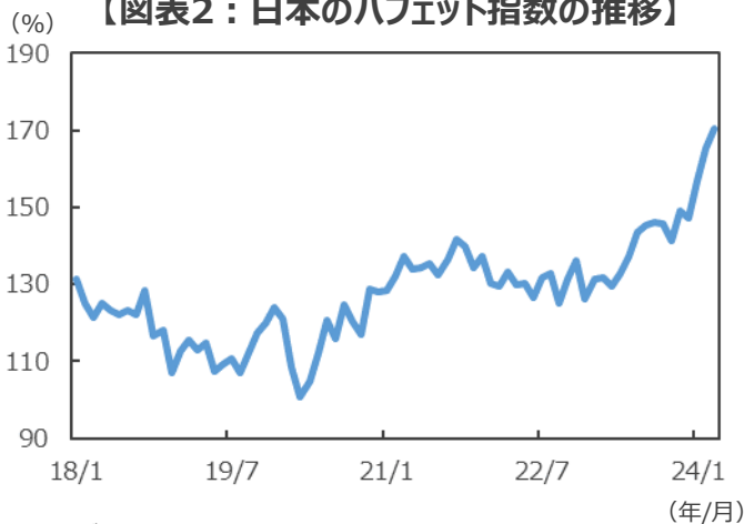
【図表2：日本のバフェット指数の推移】