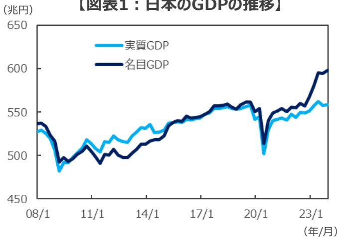
【図表1：日本のGDPの推移】

(注) データは2008年1-3月期～2023年10-12月期。